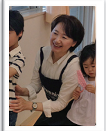
こどもの日 5・5フェスタにて