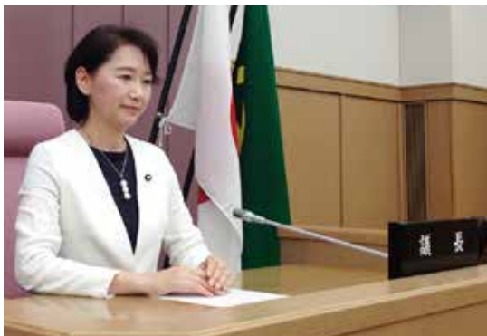
本会議場の議長席にて

このたび議会役員選挙において副議長を拝命いたしました。身に余る光栄に心より感謝申し上げるとともに、改めてその責任の重さに身が引き締まる思いです。