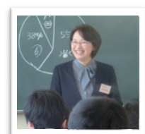
トライやるウィーク マナー講座 (川西市立中学校)