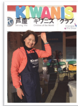
さくらまつりにて