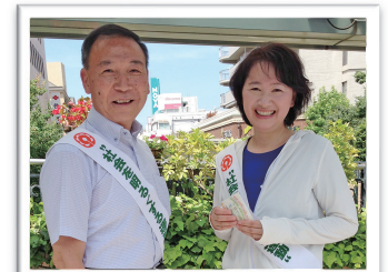
市長とともに「社会を明るくする運動」