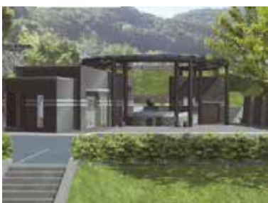
合葬式墓地イメージ図

このたびの民生文教常任委員会において、合葬式墓地だけでなく老朽化した管理棟の建設も示されました。